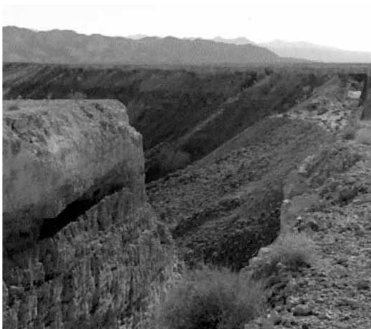
Negativo doble (1969-1970) de Michael Heizer,

Enunciados 3 , de interpretación. Dimensión simbólica del